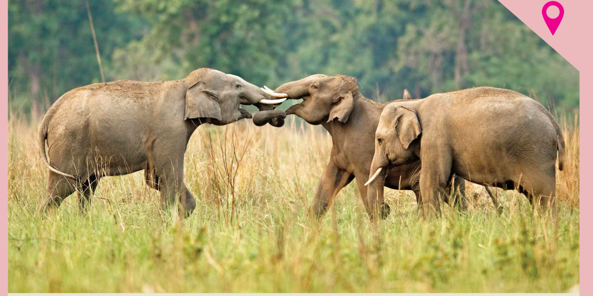
↓ முதுமலைக் காட்டில் குறைந்து கொண்டே வரும் ஆண் யானைகள்...