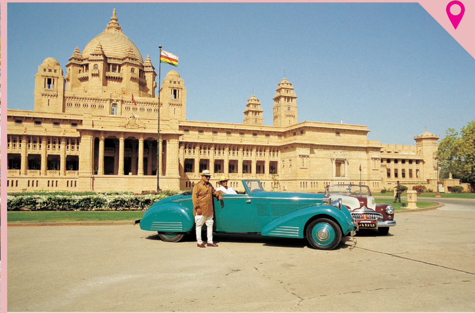
▼ ஜோத்பூர் அரண்மனை வாசலில்... ரோல்ஸ்ராய்ஸ், ப்யூக் கார்களுடன்...