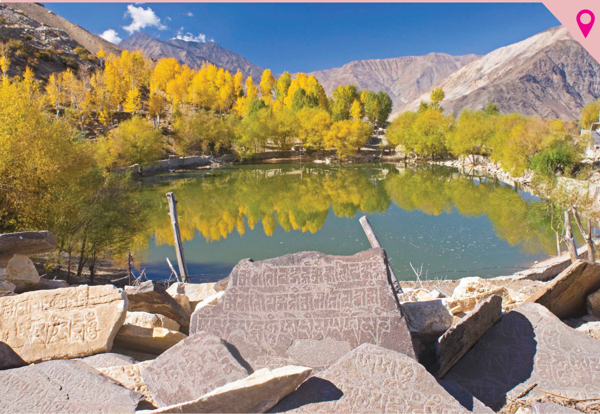
▼ ஹரிமாச்சலப் பிரதேசம், லஹௌஸ் எனும் இடத்தில் உள்ள நாக்கோ ஏரி...