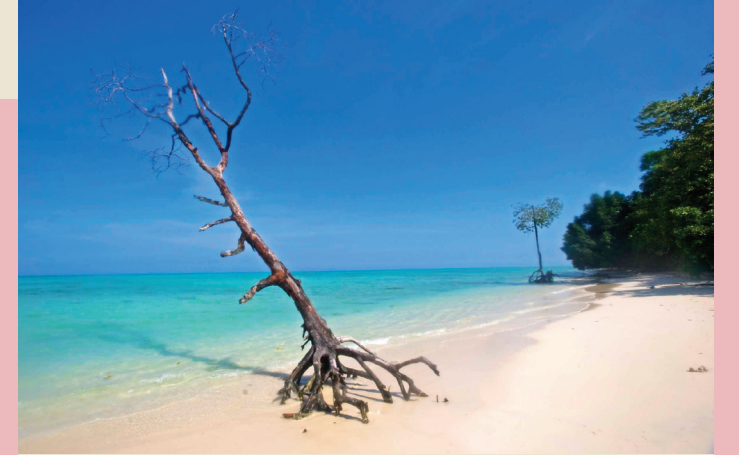
↓ அந்தமான் நிக்கோபார் தீவு...

நம் நாடு மாறிக்கொண்டே வருகிறது. சென்ற ஆயிரம் ஆண்டுகளில் ஏற்படாத மாற்றங்கள், கடந்த பத்து ஆண்டுகளில் ஏற்பட்டுள்ளது. மாற்றங்கள் தவிர்க்க